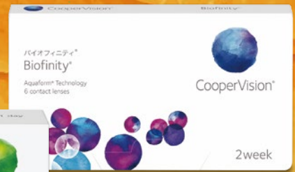
Biofinity® バイオフィニティ®